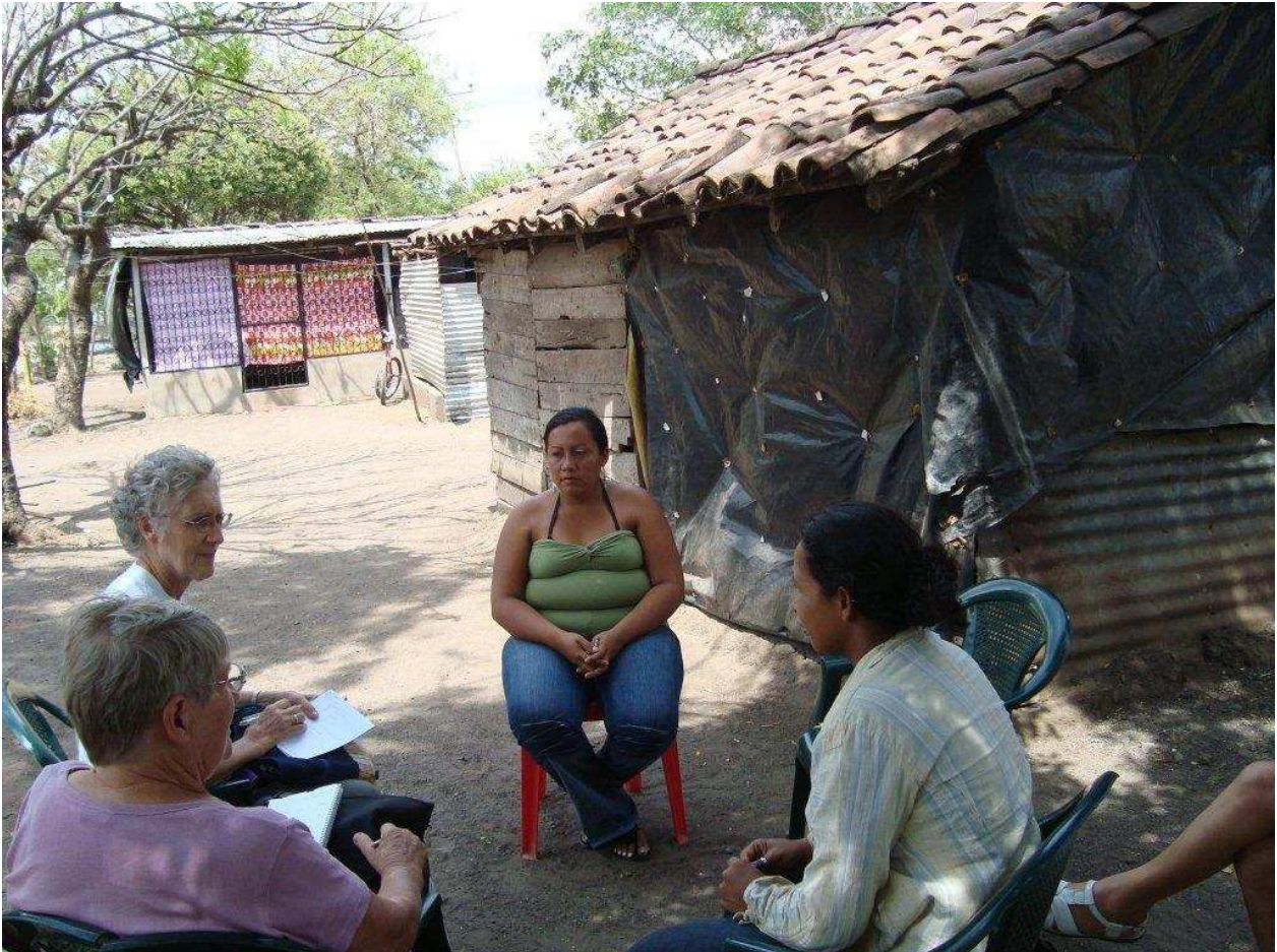
Lors des inondations, l'eau peut monter jusqu'au-dessus de la tôle en avant plan.

ne faut pas espérer que le pays va se préoccuper de ces petits villages isolés : jamais les fossés ne seront comblés et les gens sont condamnés à vivre dans la maison communautaire, dans une grande promiscuité tant que les inondations durent. Bien que le critère de fonctionnement de Quetzal ait été bien établi et que le rôle de Quetzal ne soit pas de « l'assistanat » pur et simple, devant une détresse aussi profonde et aucun autre moyen d'y pallier, Quetzal s'est décidé à distribuer ces tôles prévues pour les toits : au moins, il ne pleuvra plus même si l'eau monte !