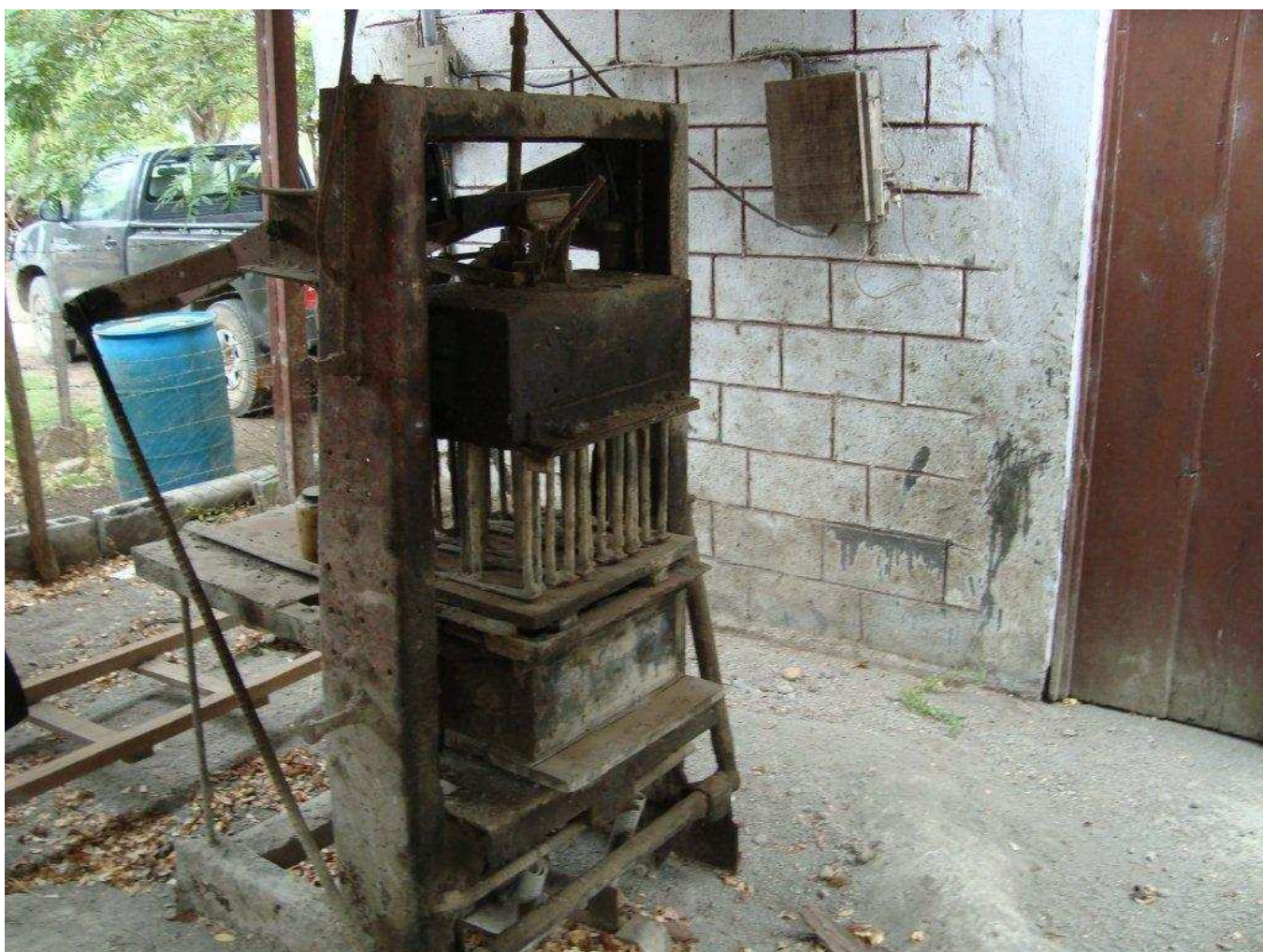
La machine à blocs

Cela donnerait du travail à quelques personnes ce qui n'est pas négligeable.